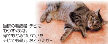
当院の看板猫・チビモ モウすく8才。 何でもかみついていて チビモ最近、おとろえが…。