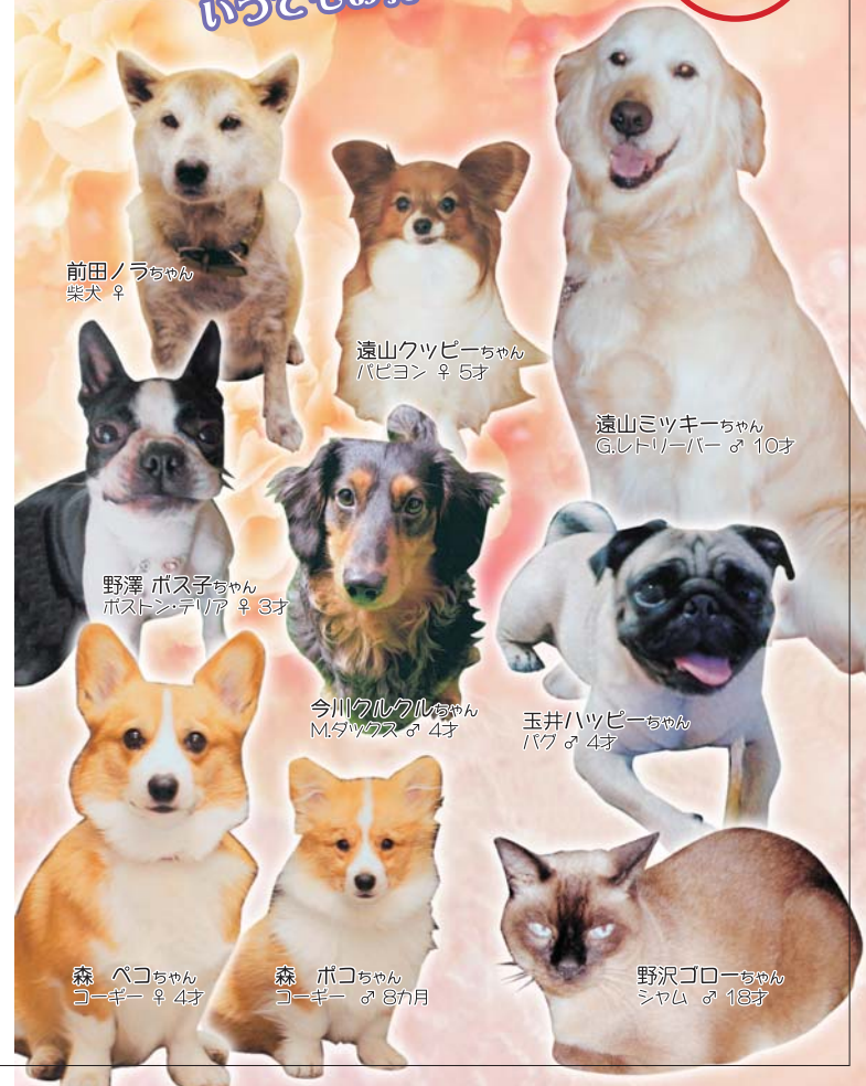
前田ノラちゃん 柴犬 ♀