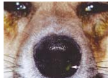
鼻涙管が正常であれば外鼻孔より染色液が出る。

眼をこすっていたり、目やにがいつもより多かったり、眼が開けづらそうな時はすぐに教えて下さいね。