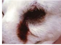
涙によって目の内側の被毛が褐色に変色したワンちゃん

涙焼けとは、過剰に出た涙が毛を濡らし、空気に触れることによって赤く変色して起こります。小型犬で被毛が白っぽい子は目立つ傾向があります。