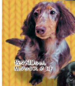
佐々木IDちゃん M.ダックス 1才