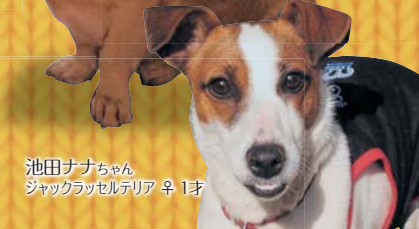
池田ナナちゃん ジャックラッセルテリア ♀ 1才