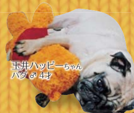
玉井ハッピーちゃん パグ 4才