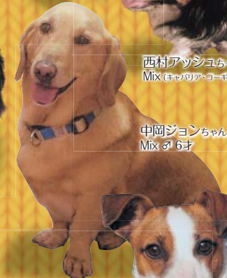
中岡ジョンちゃん Mix 6才