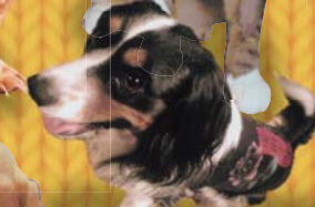
西村アツシユちゃん Mix (キャバリア・コーギー) ♂ 3才