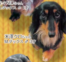
米澤クロちゃん M.ダックス 3才