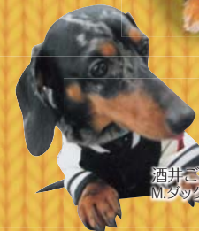
酒井ごん太ちゃん M.ダックス 2才