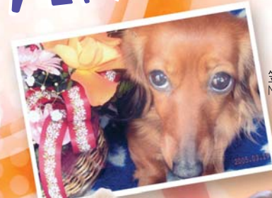
笠松チヨコちゃん M.ダックス ♀ 4才