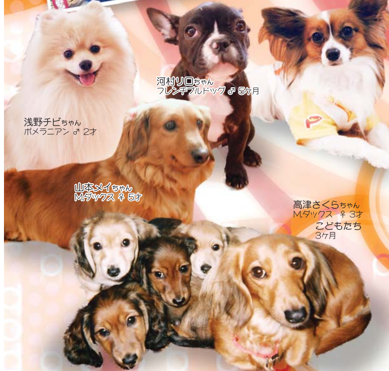
小葉シヨコちゃん パピヨン ♀ 2才